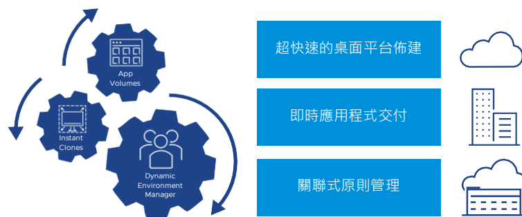
圖 1：即時管理技術可降低成本與複雜性。

只要運用 Instant Clone、VMware App Volumes™ 與 VMware Dynamic Environment Manager™ 等技術，就可在短短幾秒之內快速部署功能完善的個人化虛擬桌面與應用程式。Instant Clone 桌面平台採用靈活的佈建方式，可在不同工作階段之間保留使用者自訂內容與角色，並於登出時銷毀，以利下次登入時快速部署更新的映像與應用程式。Horizon 平台具備一對多佈建機制與完整的 API 擴充性，可簡化和自動化次要作業 (包括映像、應用程式、設定檔與原則) 的管理。IT 可運用這項輕量型的現代化方法來簡化管理、節省時間並降低成本，同時無須犧牲使用者的自訂與個人化內容。