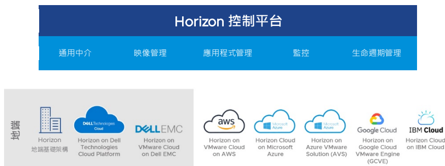
圖 2：運用雲端資源進行混合式交付與管理。使用 Horizon 控制平台，簡化不同雲端中的 VMware® Virtual Desktop Infrastructure 與應用程式管理。

彈性部署選項可跨私有雲與公有雲 (如 Microsoft Azure、VMware Cloud™ on AWS 與 Google Cloud) 實現混合雲與多雲架構。Horizon 控制平台提供隨時保持在最新狀態的服務，可跨越不同資料中心與雲端連結 Horizon Pod 的授權和管理層，以因應監控、映像、應用程式及生命週期管理等挑戰。整合式通用中介 (Universal Broker) 提供全域授權層，讓終端使用者能在任何連線的 Pod 或雲端中，存取其個人桌面平台或應用程式，進而享有依據鄰近性提供的最佳化使用者體驗。有了上述種種功能，再輔以即時的桌面平台與應用程式交付，以及一致的端對端安全性，就能妥善因應各種主要混合式使用情境，例如業務續航力、即時暴增、災難復原與高可用性等，讓您的雲端投資既簡化又最佳化。