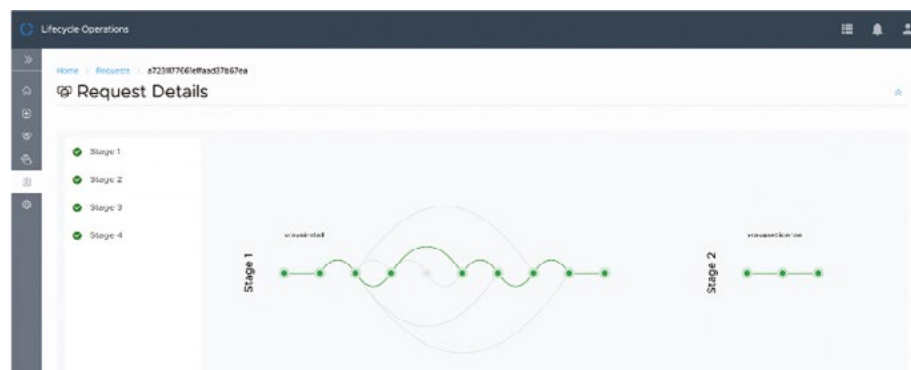
圖 2: EASY INSTALLER 會顯示整個安裝階段的進度。